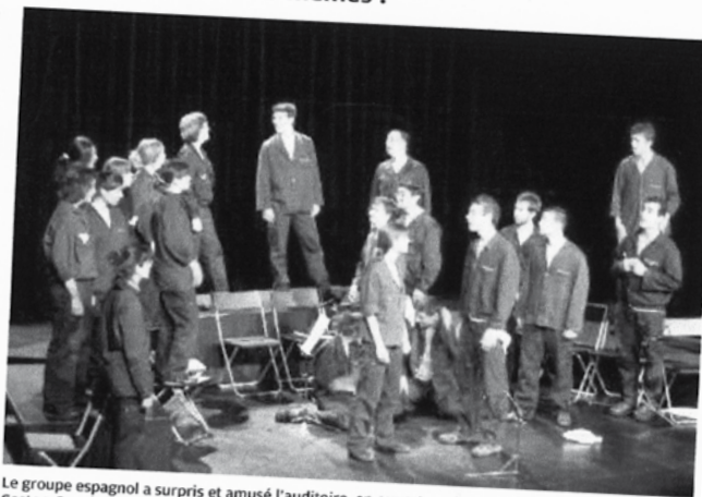
Le groupe espagnol a surpris et amusé l'auditoire, en ouverture du festival, vendredi soir, salle Gaston-Couté : la chorale n'est pas rasoir !

Superbe mais plus aride, plus convenu dans la mise en scène aussi « Le Bestiaire » chanté à plusieurs formations dans le couvent des Cordeliers. L'endroit se prête bien sûr à ce type